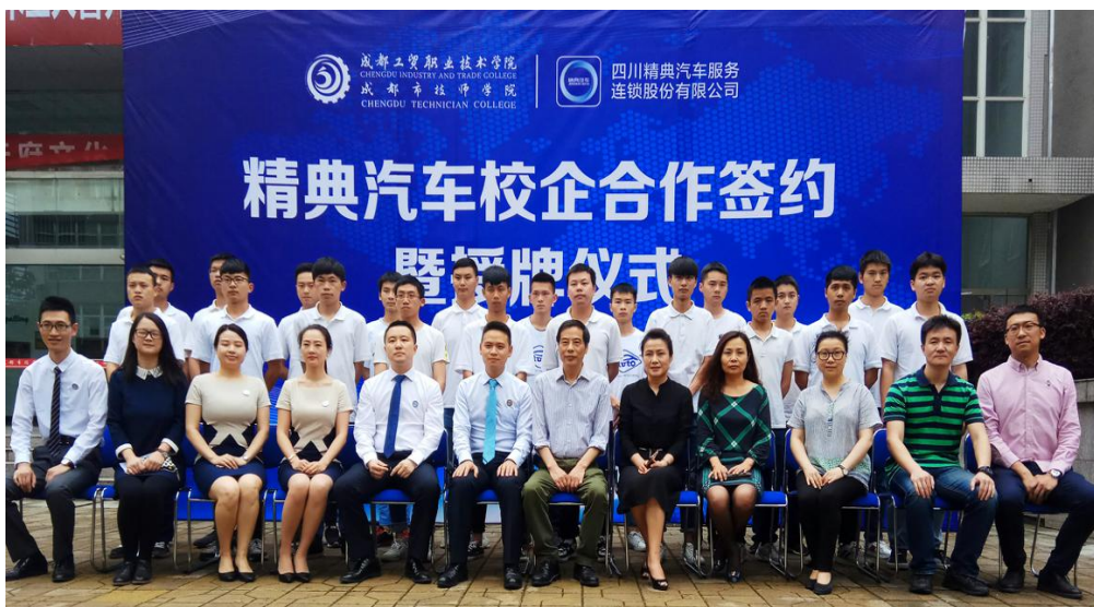
图七 7：精典汽车签约仪式暨授牌仪式