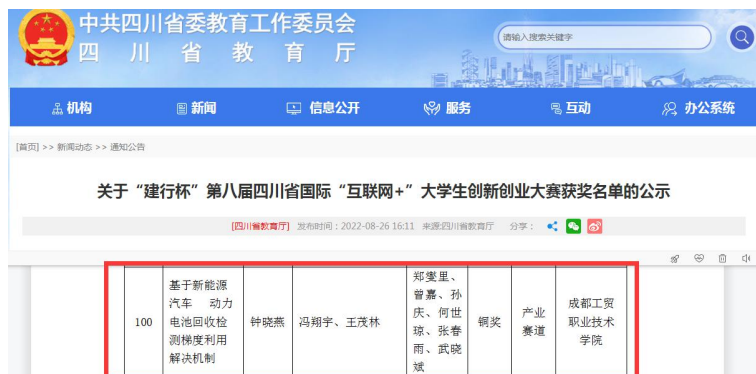
图 9: 获奖公示

四是助力创新创业工作开展。2022 年协助指导汽车工程学院“基于新能源汽车动力电池回收检测梯度利用解决机制”项目双创团队, 荣获第八届四川省国际“互联网+”大学生创新创业大赛产业赛道铜奖。