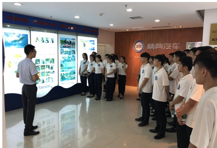
图 3：企业实习实训（校外）