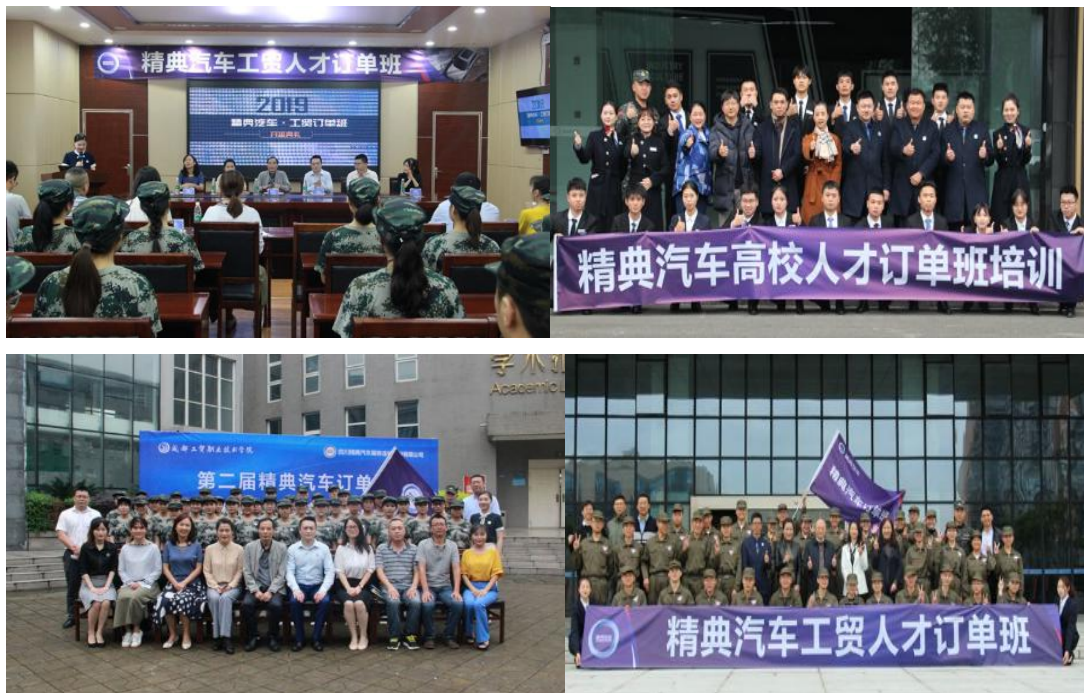
图 8：各届订单班开班仪式

二是五年来跟精典汽车连续组建五届精典汽车订单班，给精典汽车 430 余家门店定向培养 200 多人毕业生，分布在成都各大区域、这些学生进入客户、维修、销售、金融等精典各大业务领域，很多学生都走上管理岗位。