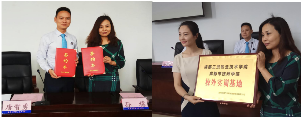
图 6：签约仪式暨授牌仪式